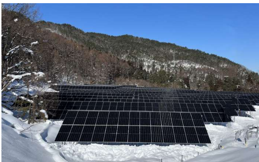
▲コーポレートPPA先の一つ長野県田上市の太陽光発電所（発電事業者：スマートブルー株式会社）