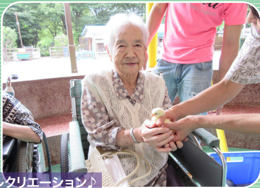
レクリエーション♪