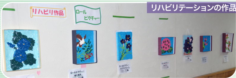
リハビリテーションの作品♪