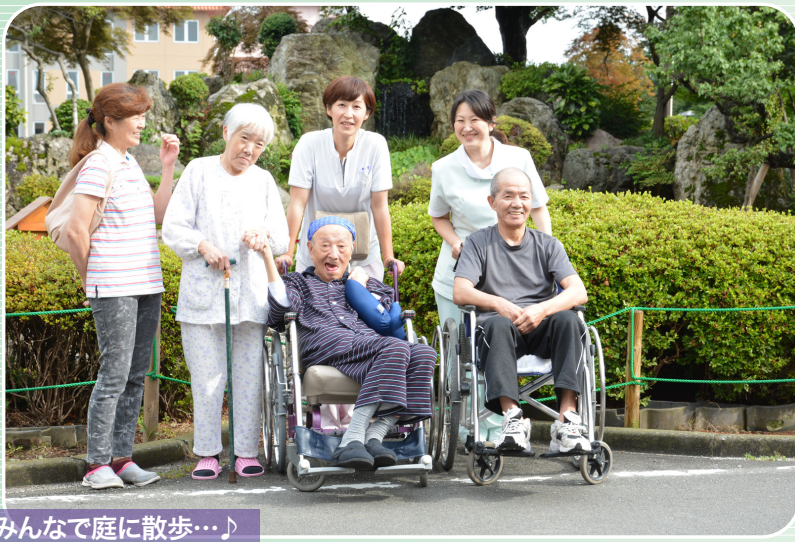
みんなで庭に散歩…♪