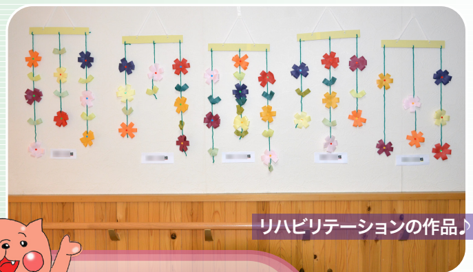
リハビリテーションの作品♪