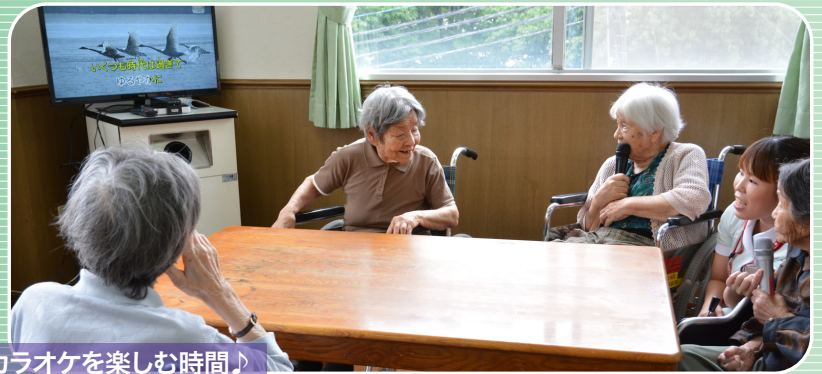
カラオケを楽しむ時間♪