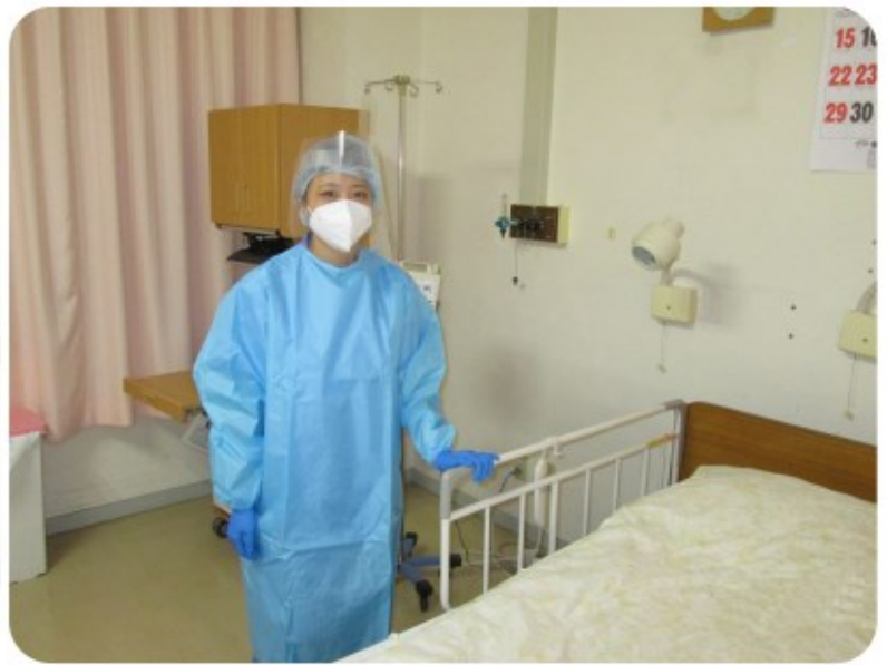
防護服・手袋・フェースシールドで完全防備